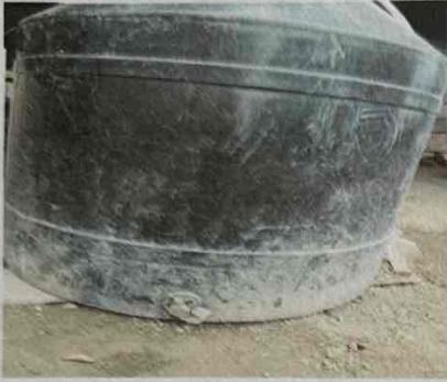
Foto1: Sustitución de tinaco para agua.